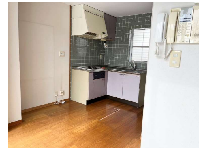
キッチン・ダイニング