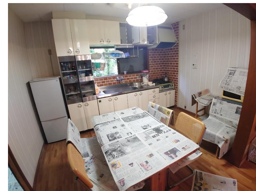
ダイニング・キッチン