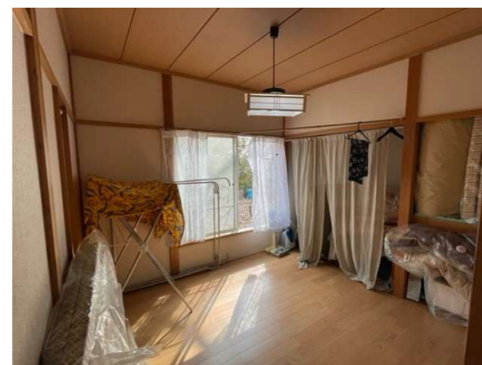
洋室 4.5 帖 (旧和室)