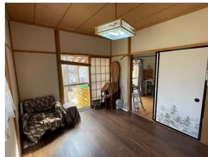
洋室 6 帖 (旧和室)