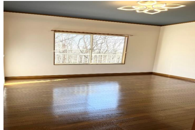
2階 洋室 1