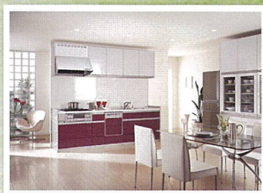
キッチン改装 使いやすいシステムキッチンで収納上手。