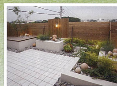
外構工事 玄関までのアプローチ。家の魅力を引き立てる重要なアクセントに。