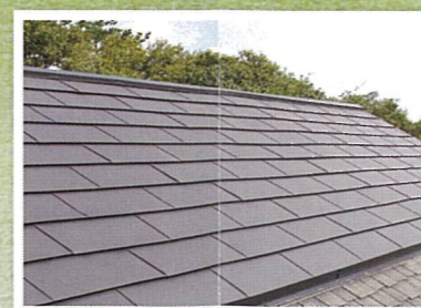
屋根・外壁塗装 建物の中で一番傷む場所だから10年毎のメンテナンスをおすすめします。