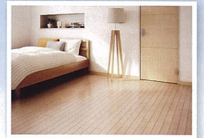
クロス・フローリング張替え お部屋を明るく模様替え。