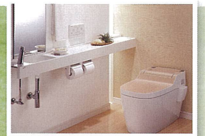
トイレ改装 節水タイプの最新の水洗トイレでおしゃれに快適に。