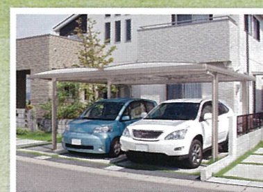
駐車場工事 駐車台数を1台から2台に。カーポートで雷や落ち葉から愛車を守る。