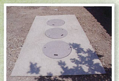
浄化槽 合併浄化槽でより衛生的に。環境にも優しく。