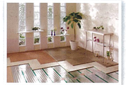
床暖房 床暖房でひだまりの温かさ。