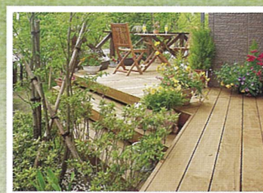
ウッドデッキ作成・塗装 バーベキューにコーヒープレイク。楽しいアウトドアライフが始まります。