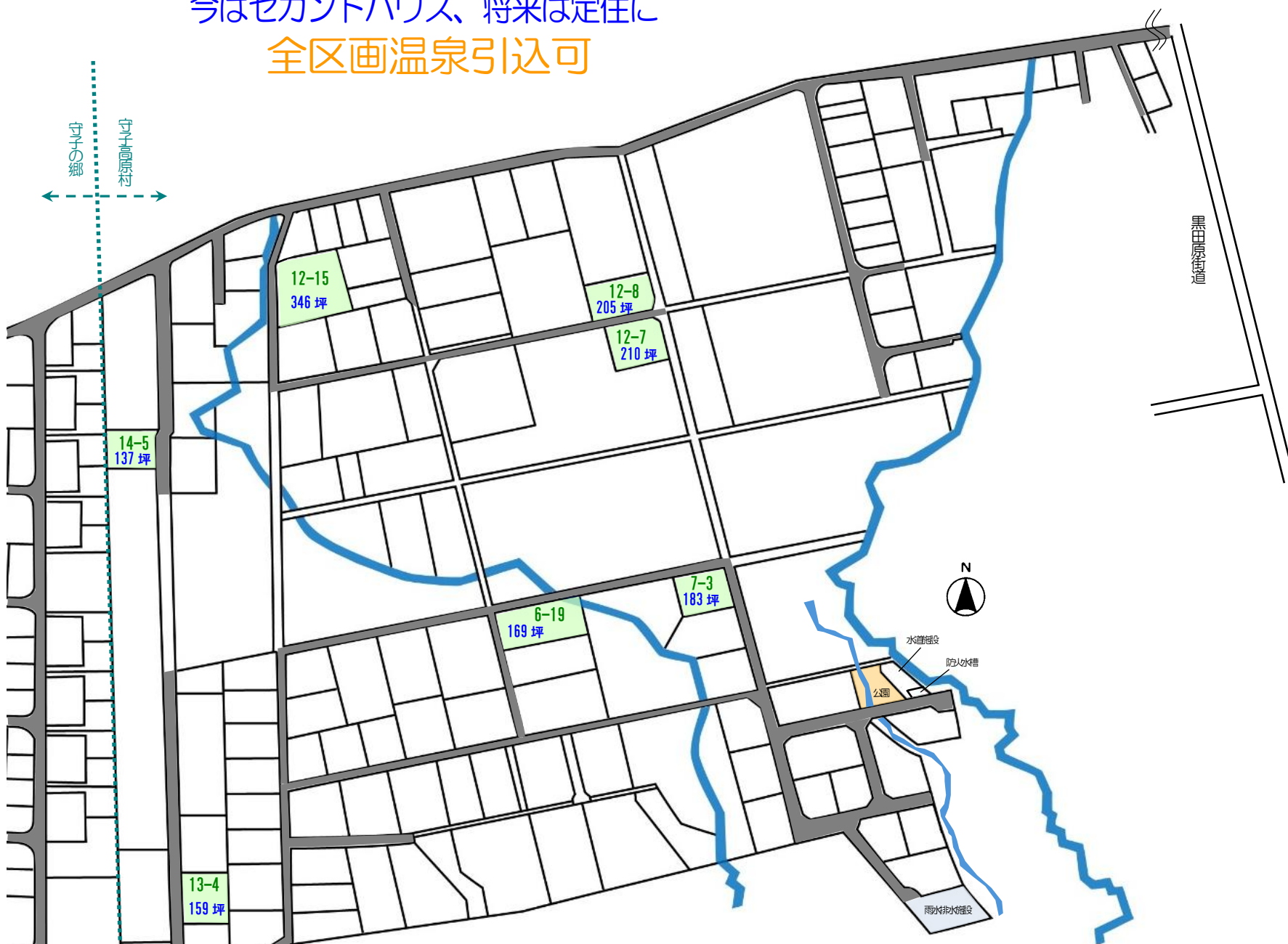
守子高原村 位置関係図